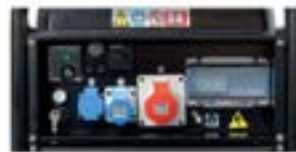
Käyttöpaneeli mallista Technic 15000 TE AVR