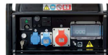
Käyttöpaneeli mallissa Technic 15000 TE AVR

Automaattinen jännitteensäädin. Automaattisen jännitteensäätimen ansiosta jännitteenvaihtelu vain ±2% (normaaleissa aggregaateissa ±10%).